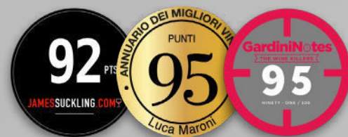
TENUTA MORAIA CALANDRINO MAREMMA TOSCANA DOC