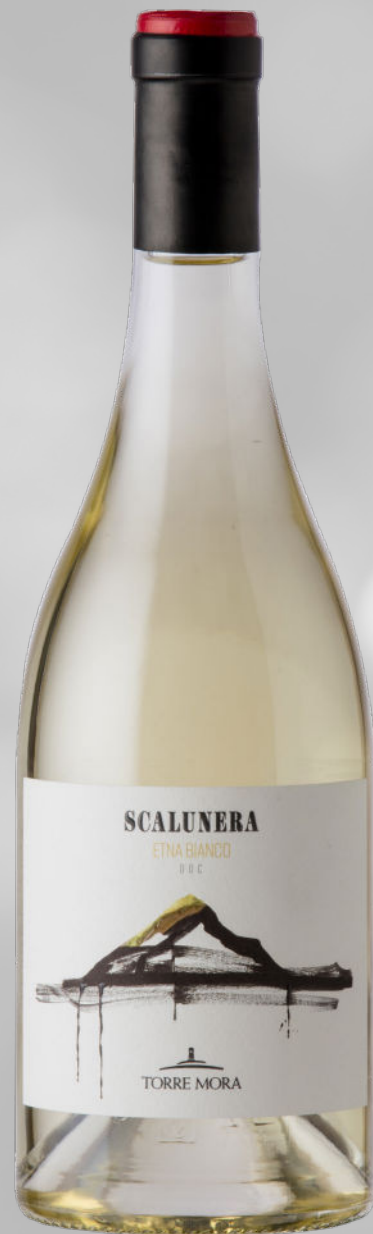
TORRE MORA SCALUNERA ETNA BIANCO DOC 2023